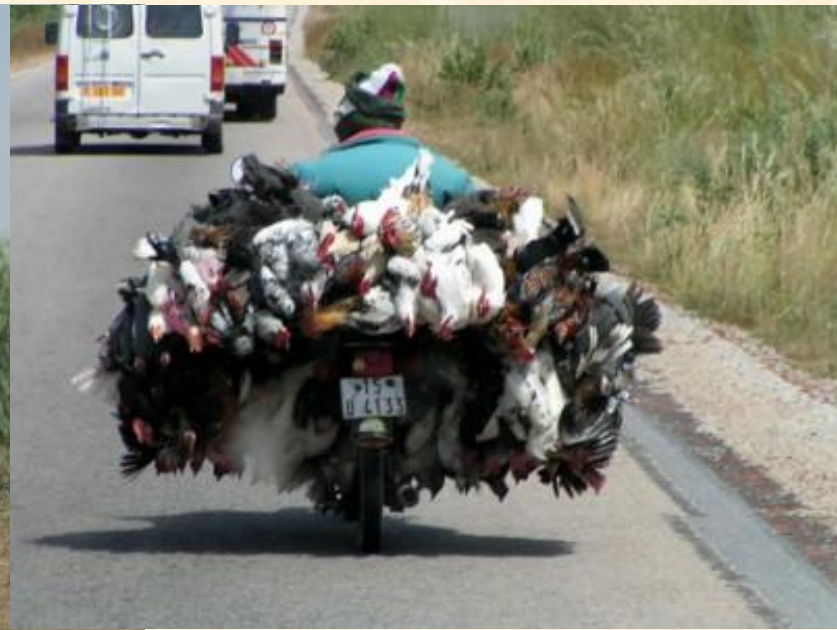
Poulet-bicyclette au Burkina