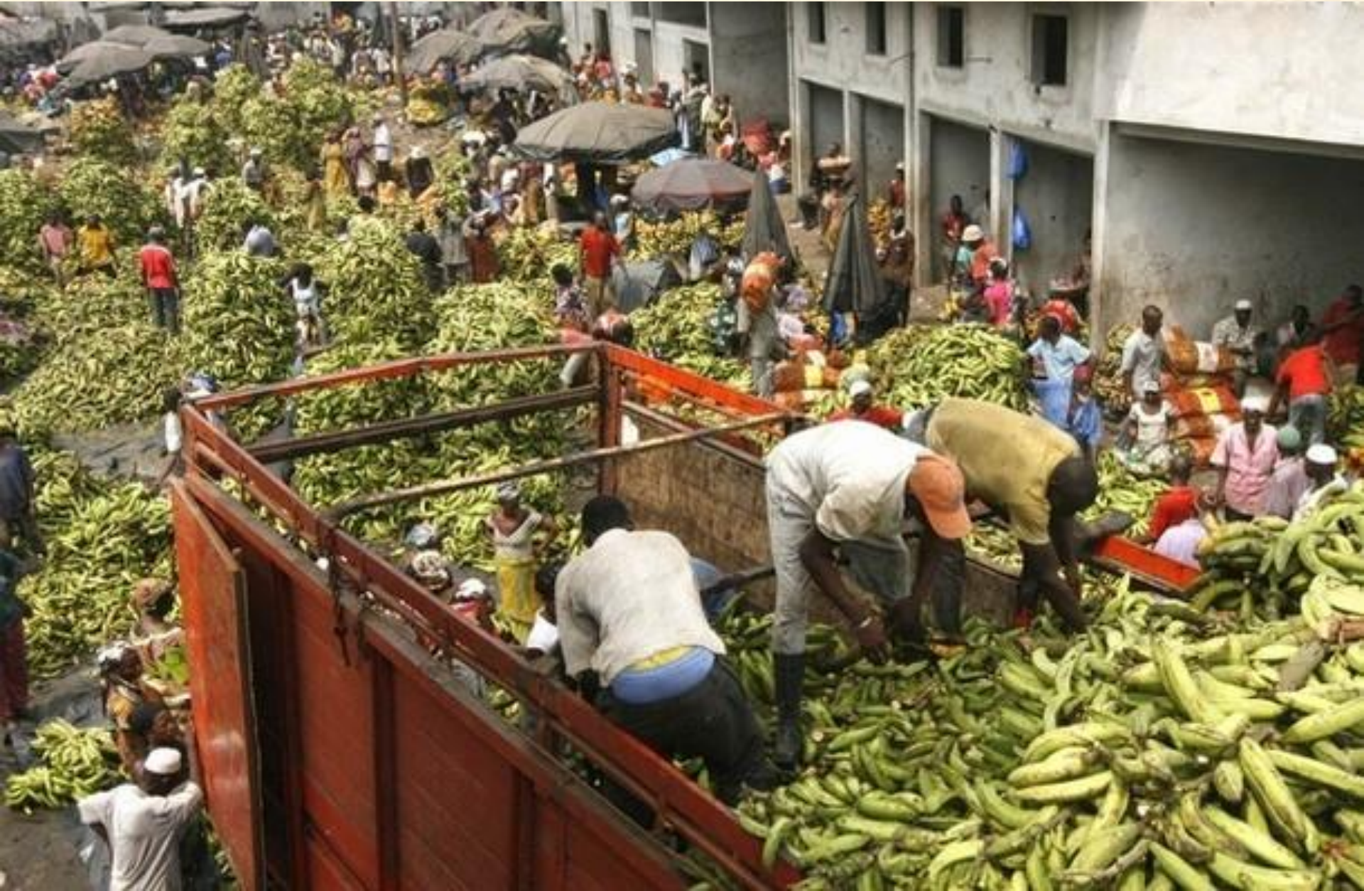
Le marché de gros de la banane plantain (« alloco ») à Abidjan